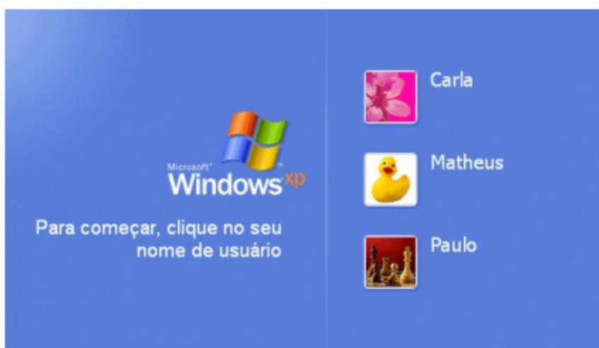
Tela de Logon.

Ao iniciar o Windows XP a primeira tela que temos é tela de logon, nela, selecionamos o usuário que irá utilizar o computador 1 .