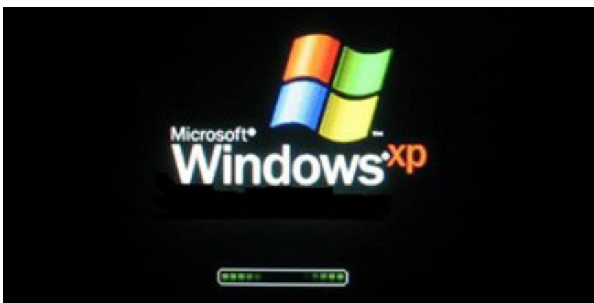
Inicialização do Windows XP.

O XP embute uma porção de acessórios muito úteis como: editor de textos, programas para desenho, programas de entretenimento (jogos, música e vídeos), acesso à internet e gerenciamento de arquivos.